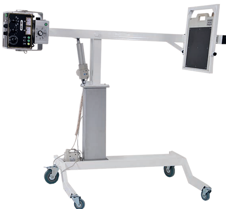
Комплект компании «НОЭЛСИ» (2013 г.)

Ответчик представил документы, которые ни в коем случае нельзя назвать технической документацией. Скорее, они выглядели, как очень вольные графические эскизы изделий без подробных описаний и размеров. Поэтому мы подали второе ходатайство, в котором указали, что «...сторона Истца (ООО «НОЭЛСИ») просит суд оказать содействие в сборе доказательств по делу и запросить у Ответчика технические усло-