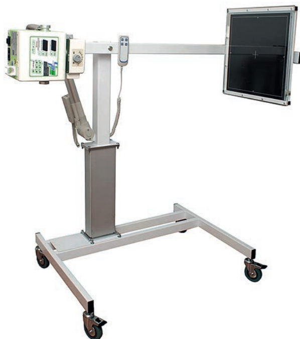
Комплект компании «Медикал-Сервис» (2018 г.)